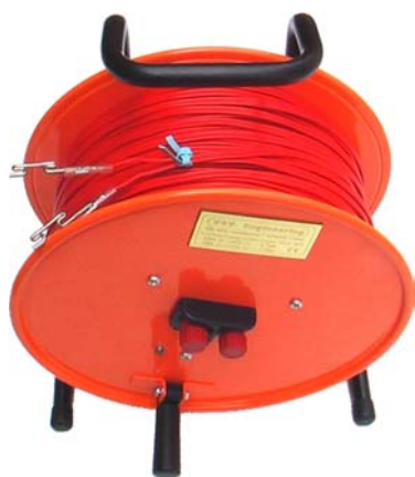
Tambour de ligne de tir standard (ligne de tir bipolaire) avec 200 m ligne de tir bipolaire Cu STC6 2 x (4 x 0,6 mm Ø) – Réf. 1064-000000

Le tambour de ligne de tir standard (pour ligne de tir bipolaire) est une construction stable de tôle en acier avec revêtement de résine de polyester en couleur orange.