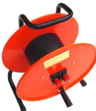
vide – Réf. 1064-000001